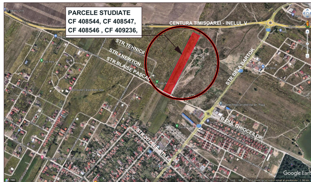
EXTRAS GOOGLE EARTH

P.U.Z. ” ELABORARE PUZ CU DOUA ZONE FUNCTIONALE – DEZVOLTARE ZONA PREPONDERENT REZIDENTIALA P+1E+M/ER SI ZONA PENTRU INSTITUTII SERVICII SI BIROURI”, CF408544, CF408547, CF408546 , CF409236, Amplasament: EXTRAVILAN DUMBRĂVIȚA , Suprafață totală teren: 24.325 mp