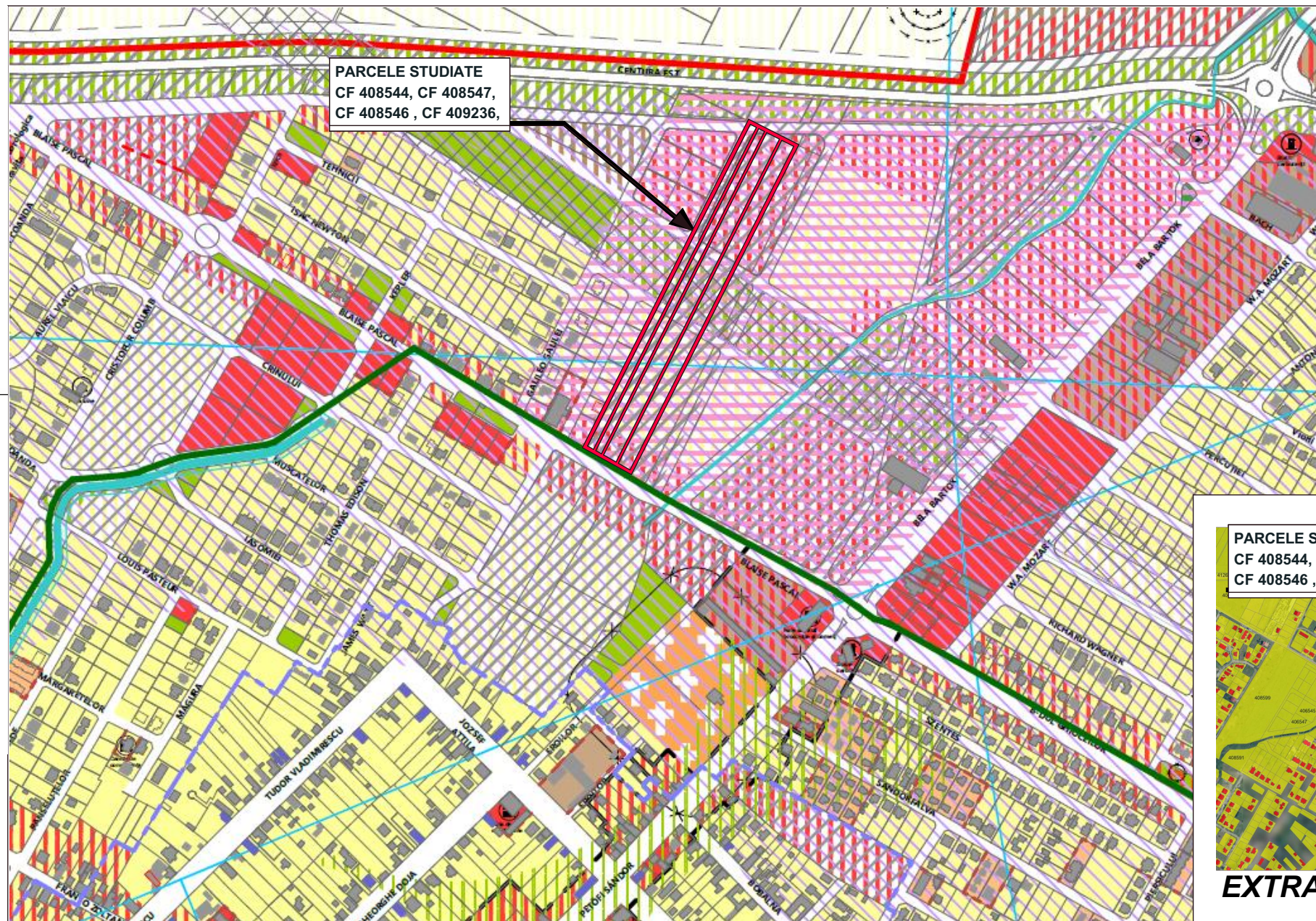
EXTRAS P.U.G. DUMBRĂVIȚA