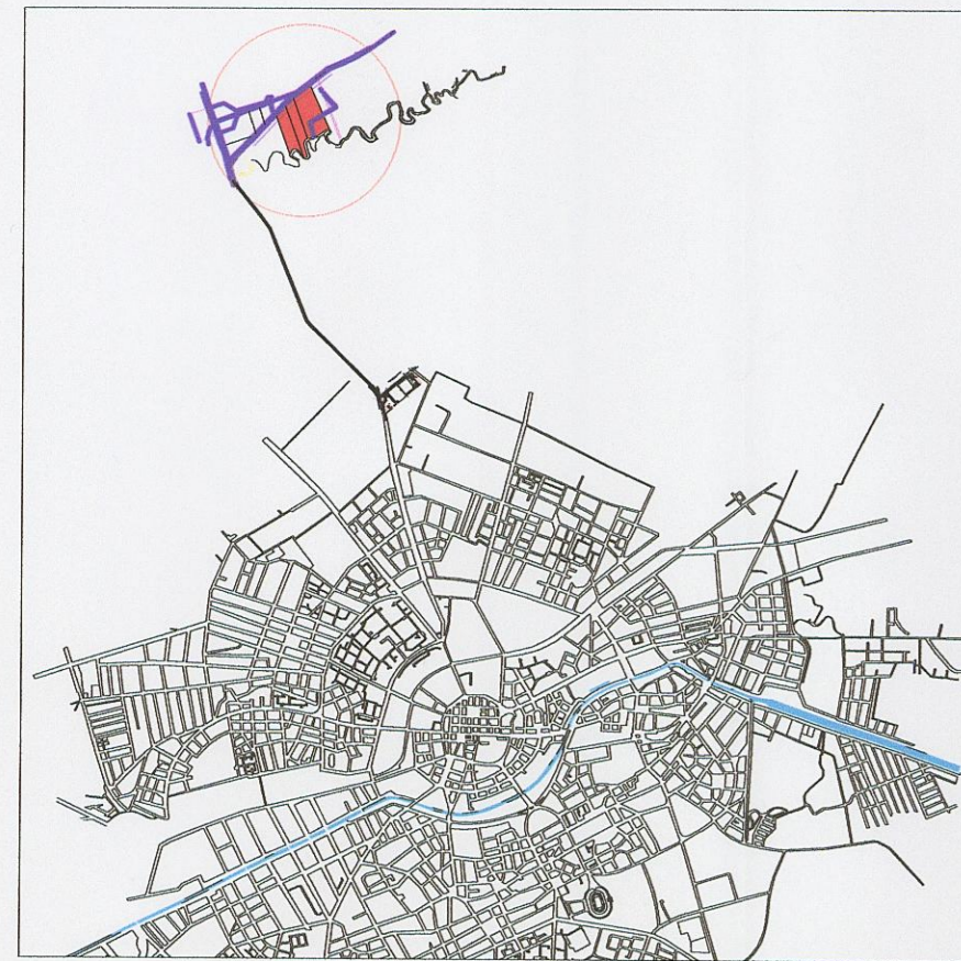
PROFILE CARACTERISTICE ( Sc 1/200 )