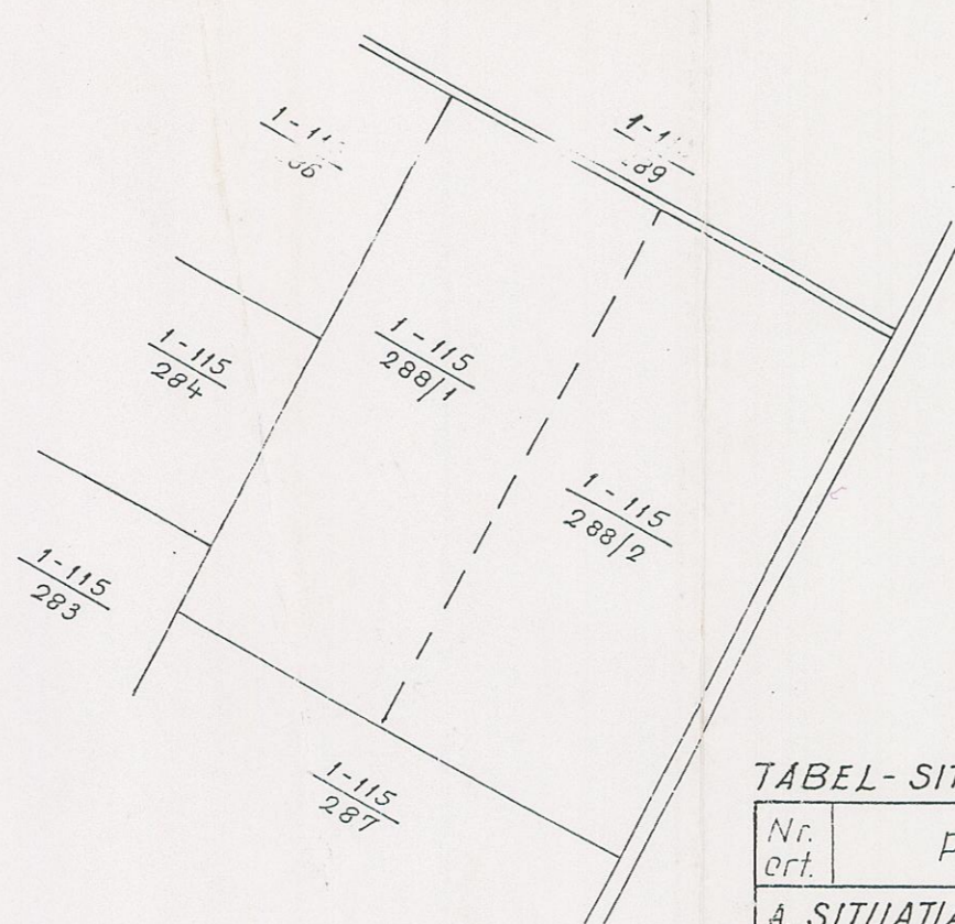
PLAN DE C.F. sc. 1: 5760