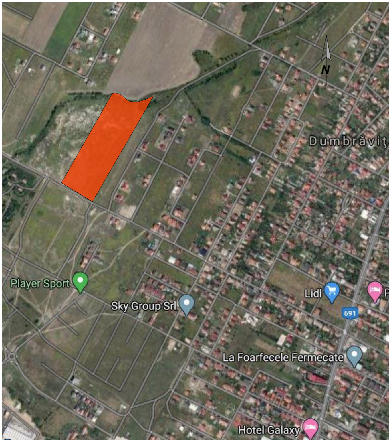
PLAN DE INCADRARE IN TERITORIU - GOOGLE